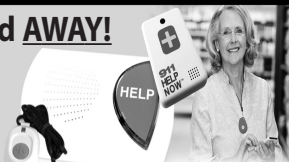
This Button SAVES Lives! As Shown GPS, Lowest Price Guaranteed!