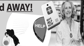
This Button SAVES Lives! As Shown GPS, Lowest Price Guaranteed!