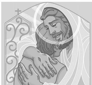
Grande será tu recompensa en el cielo

Cuando pensamos en la palabra “bienaventuranza” pensamos en el discurso de hoy del Evangelio según Lucas, o en el más familiar según Mateo (que comienza “Dichosos lo que tienen espíritu de pobre . . .”). En realidad, las bienaventuranzas ocurren en los profetas y evangelios. Hoy, en Jeremías (con un eco en el salmo) oímos: “Bendito el hombre que confía en el Señor” (Jeremías 17:7). Luego de su resurrección en el Evangelio de san Juan, Cristo proclama: “¡Dichosos los que creen sin haber visto!” (Juan 20:29). Los evangelistas colocaron estos dichos por todos los evangelios como cortos recordatorios sobre las características de quien sigue a Cristo, características que ayudarán a diseminar la Buena Nueva en esta vida y llevarnos a la dicha eterna en la próxima. En latín, los santos son llamados Beati o “Beatos” porque son aquellos que viven la vida “feliz” descrita por Jesús en los evangelios. ¡Qué dichosos somos cuando nos esforzamos por hacer de nuestros días bienaventuranzas vivas!