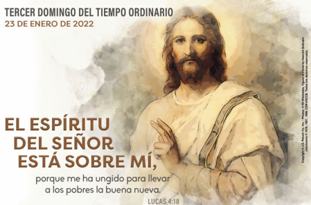
TERCER DOMINGO DEL TIEMPO ORDINARIO 25 DE ENERO DE 2022

Dios todopoderoso y eterno, dirige nuestros pasos de manera que podamos agradarte en todo y así merezcamos, en nombre de tu Hijo amado, abundar en toda clase de obras buenas. Por nuestro Señor Jesucristo, tu Hijo, que vive y reina contigo en la unidad del Espíritu Santo y es Dios por los siglos de los siglos.