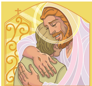
Grande será tu recompensa en el cielo